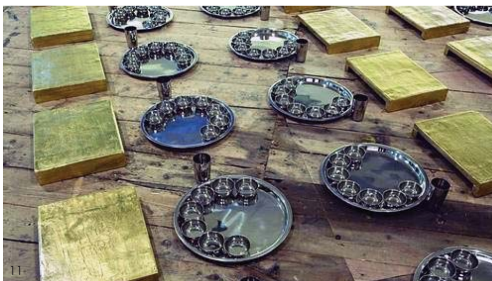
09 哈莉特 (最后的肖像)