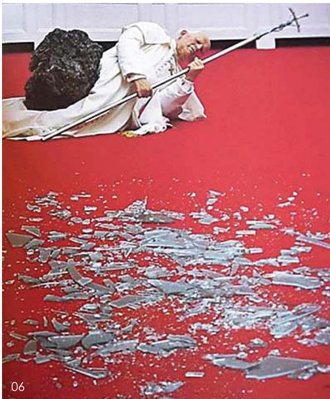
06 第九个小时 莫瑞吉奥·卡特兰