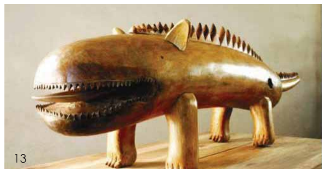
13~15 上海大学美术学院雕塑系学生作品

这个课程有三个层次，第一，是通过书法的平面形态转换为立体研究课题；第二，书法是一种具有个人体验，体现中国文化特色的身体行为艺术，本课程与中国文化思想有某种深度的联系，通过形态研究感悟内在的思想性；第三，通过传统的书写的体验、学习、理解、认识，创造自己的作品。启发学生关注个人的体验，培养独