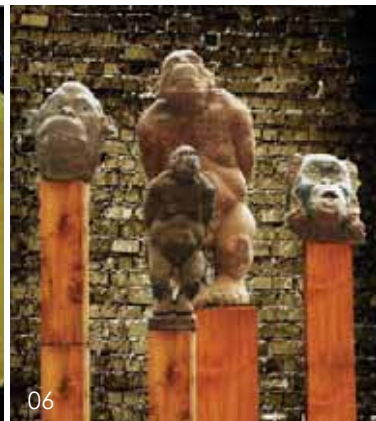
04~06 西安美术学院雕塑系学生作品