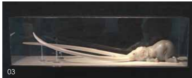
01~03 四川美术学院雕塑系学生作品