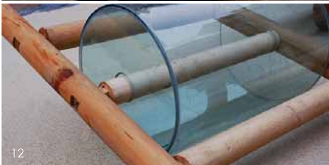
10~12湖北美术学院雕塑系学生作品

主要是城市雕塑和环境雕塑设计的传授和训练，已经准备引入公共环境，借鉴一些建筑方面、环境设计方面的经验。