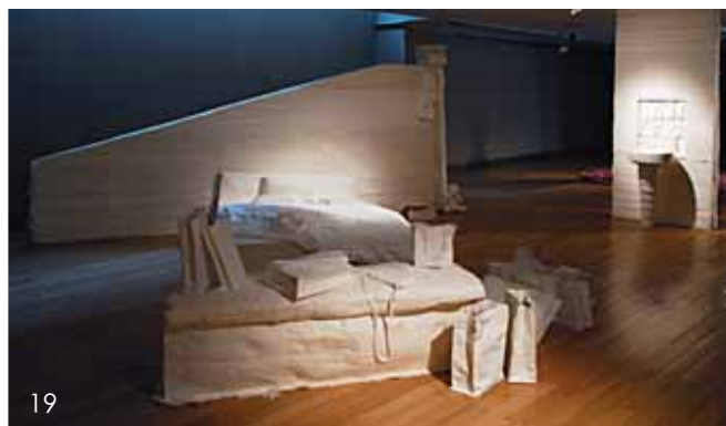
19~22 中国美术学院雕塑系第五工作室

公共艺术其实培养的目标和我们造型学院美术的渊源很深，尤其是空间造型这块、公共空间这块。我们培养学生知识构成有几个部分：第一，基础，素描、色彩的基础。第二，1/3是专业的城市雕塑，再1/3是关于现、当代艺术的，再1/3是公共艺术方面、城市设